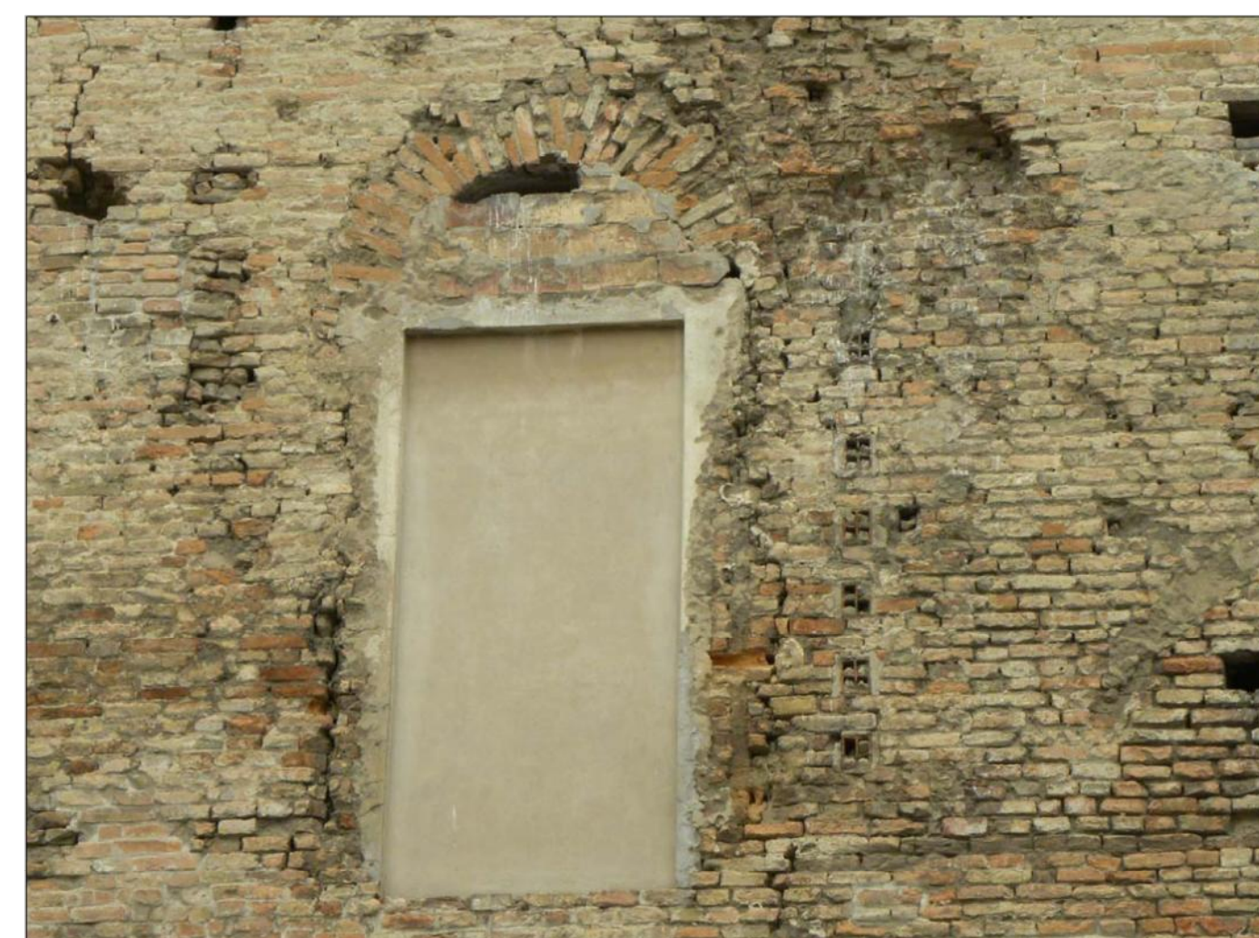
FOTO 2 - APERTURA ESISTENTE TAMPONATA