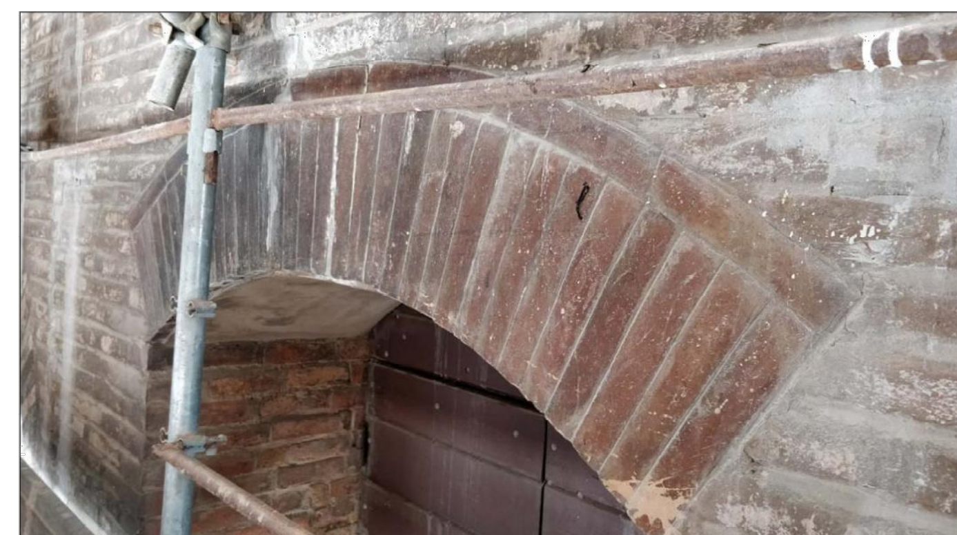
FOTO 1 - ARCO DI SCARICO SU APERTURA ESISTENTE