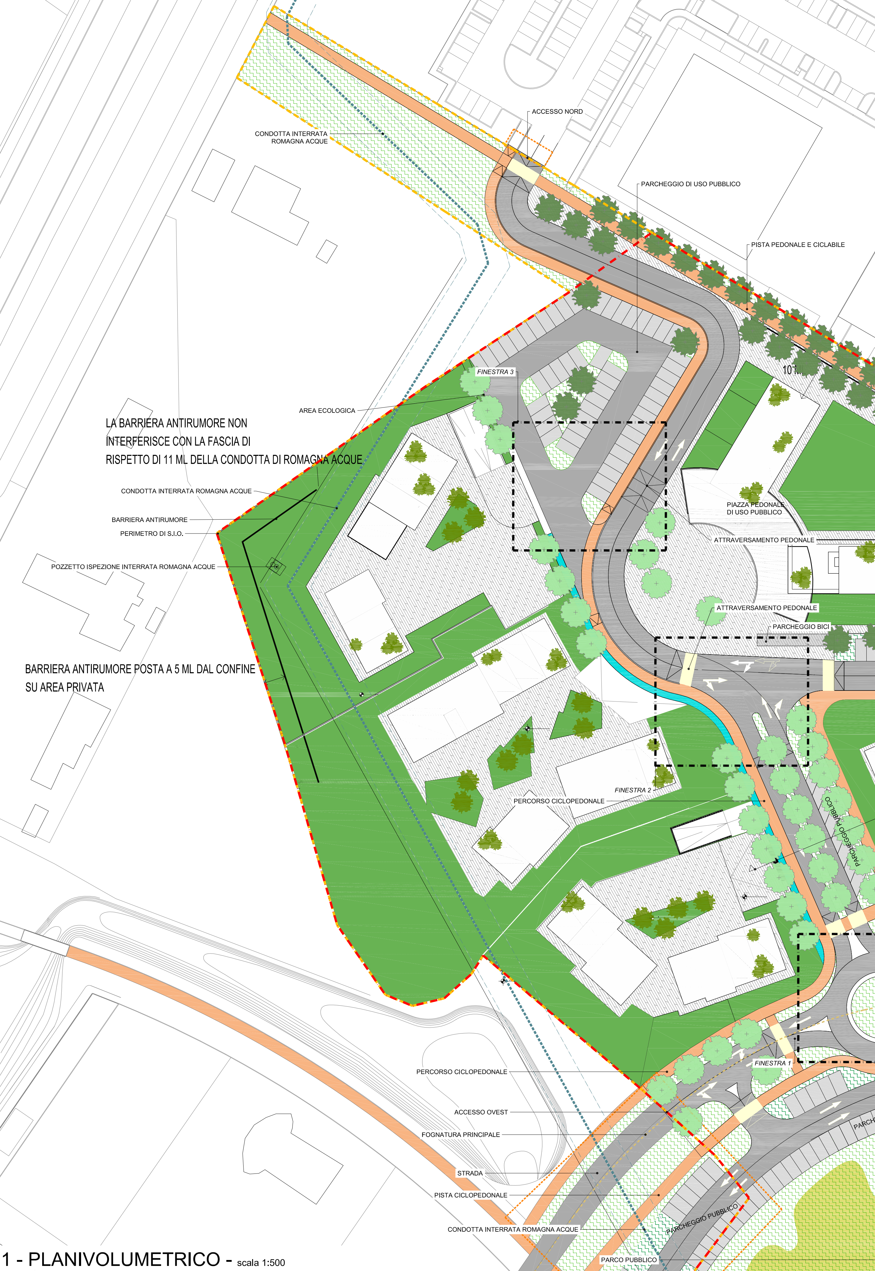
1 - PLANIVOLUMETRICO - scala 1:500

LA BARRIERA ANTIRUMORE NON INTERFERISCE CON LA FASCIA DI RISPETTO DI 11 ML DELLA CONDOTTA DI ROMAGNA ACQUE