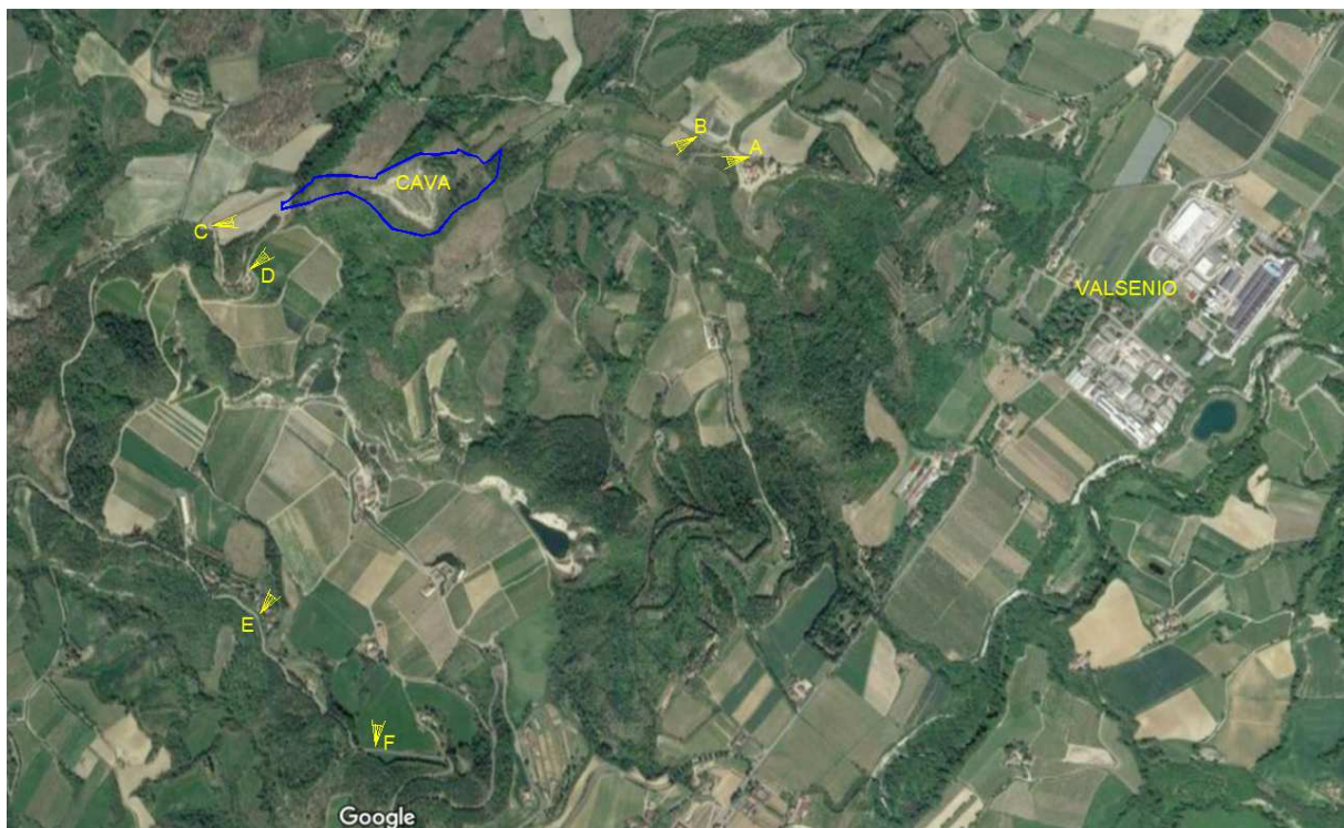
Figura 7 – Planimetria con i punti di scatto delle fotografie dai punti di visuale esterni

Nel seguito si riportano invece alcune immagini panoramiche della zona della cava da punti di visuale esterni alla stessa; i punti di scatto delle immagini sono evidenziati nella planimetria seguente.