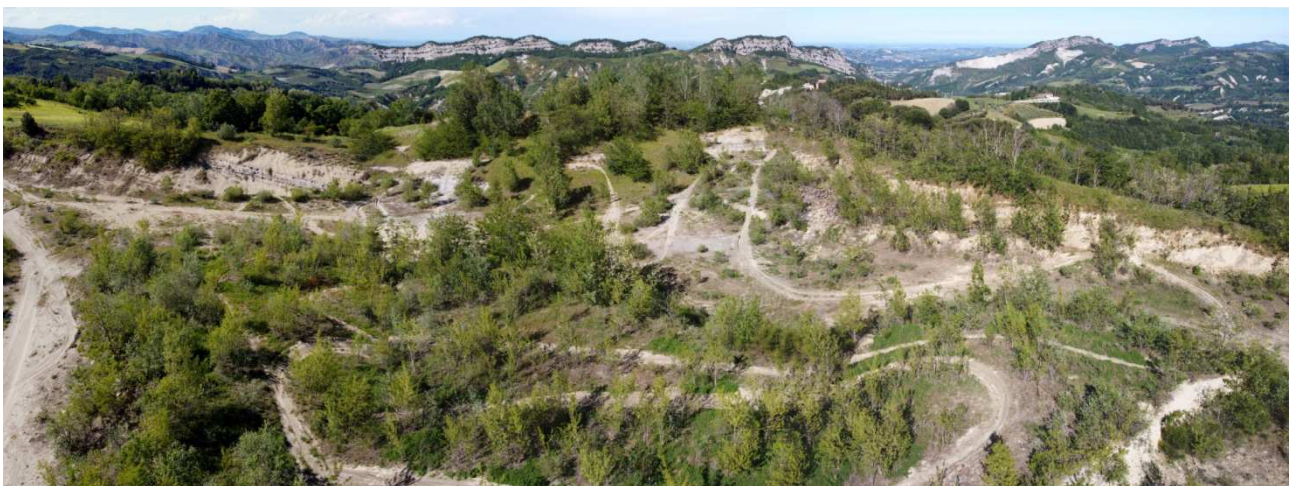
Figura 2 – Immagine panoramica dall'alto dell'area della cava Raggi di Sopra (Pan 747-748-749)