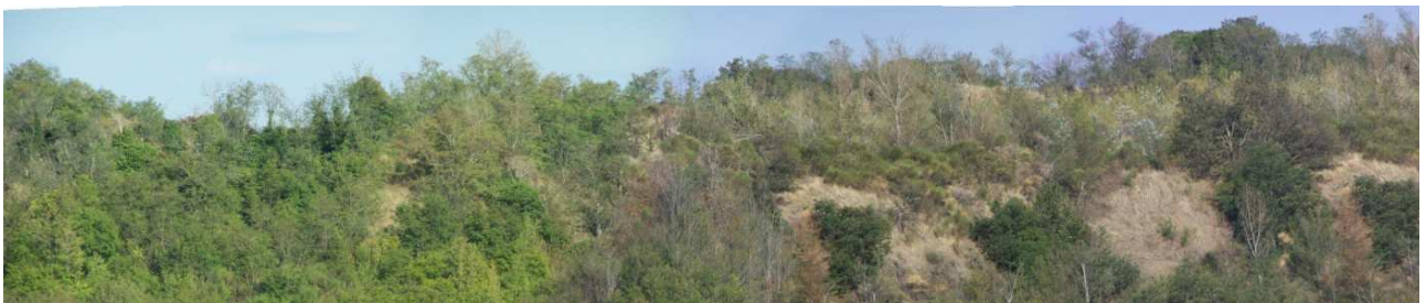
Figura 14 – Dettaglio della immagine precedente della vera e propria area di cava - scatti dal punto D