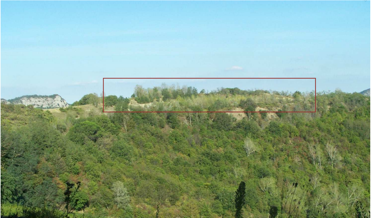
Figura 13 – Immagine panoramica della zona di cava vista da Sud-Ovest - Scatto dal punto D