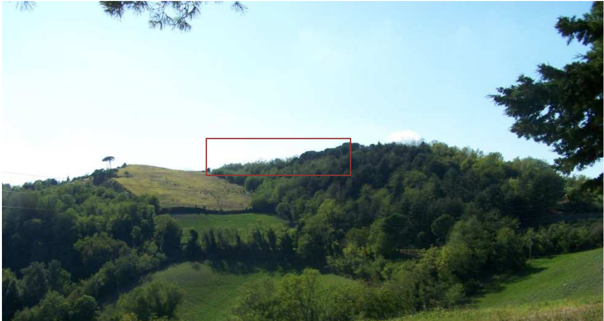
Figura 9 – Immagine panoramica della zona di cava vista da Est (via del Monte) - Scatto dal punto B