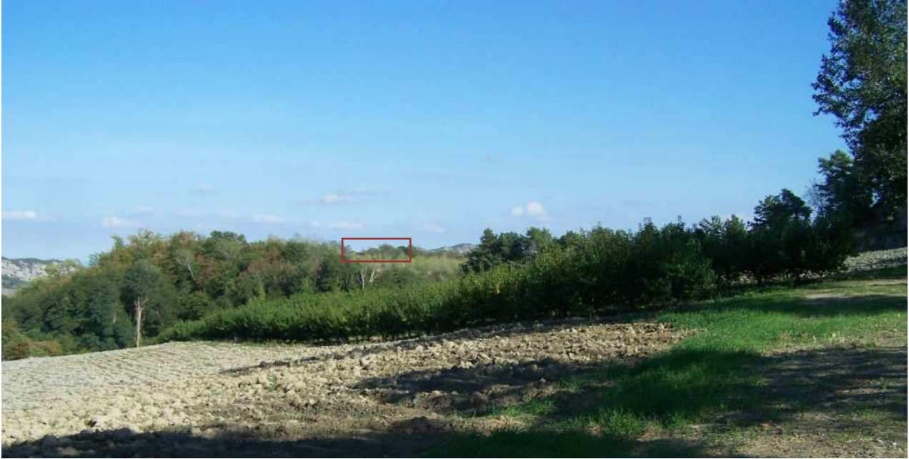
Figura 10 – Immagine panoramica della zona di cava vista da Ovest (via Campiuno) - Scatto dal punto C