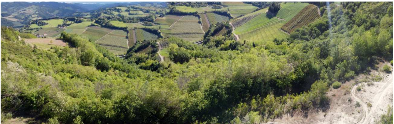
Figura 4 – Immagine dall'alto della schermatura boscata presente a Sud dell'area di cava (Pan 752-753-754)