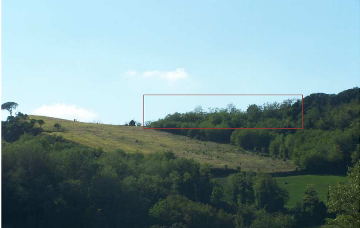
Figura 8 – Immagine della zona di cava vista da Est (via del Monte) - Scatto dal punto A