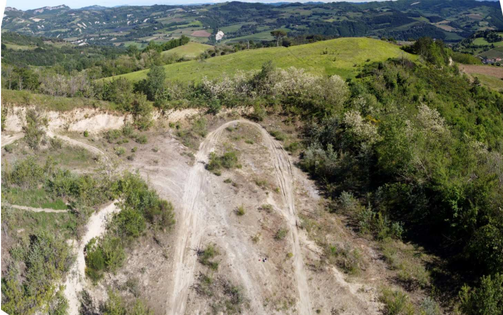
Figura 3 – Immagine dall'alto della zona est dell'area di cava (Pan 750-751)