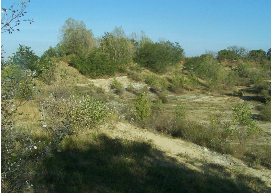
Figura 6 –Area del cava vista da ovest (scatto dalla recinzione) - Foto 2996

Nel seguito si riportano invece alcune immagini panoramiche della zona della cava da punti di visuale esterni alla stessa; i punti di scatto delle immagini sono evidenziati nella planimetria seguente.