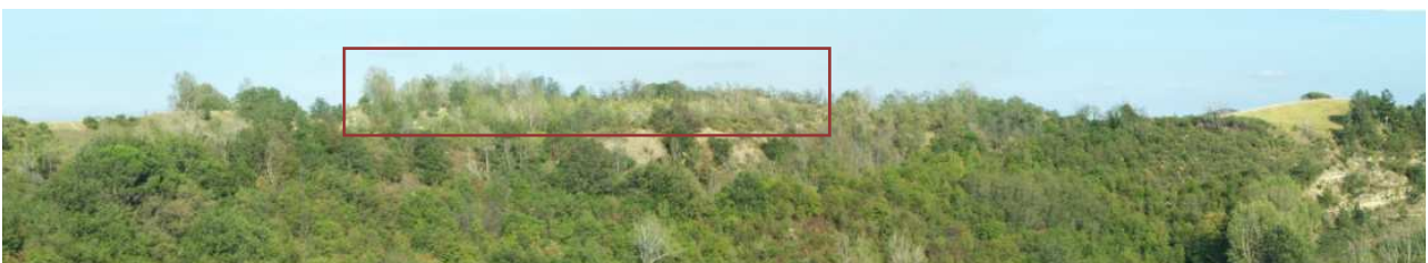
Figura 12 - Composizione panoramica di scatti dal punto D