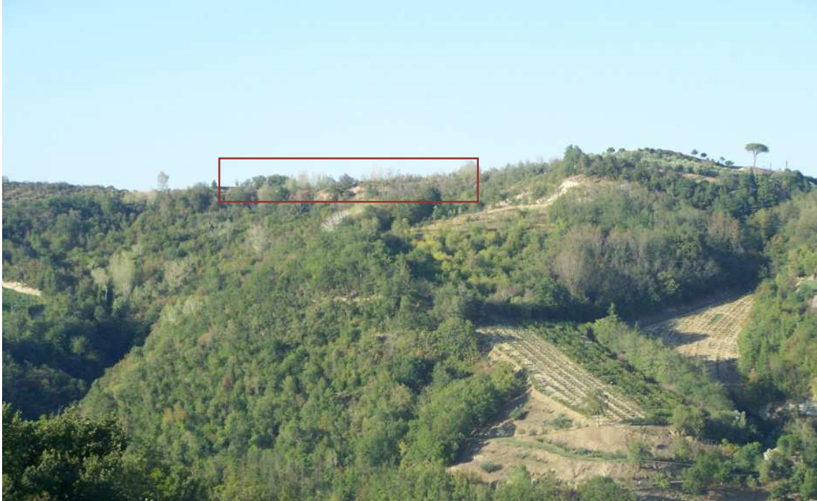
Figura 16 – Immagine panoramica della zona di cava vista da Sud - Scatto dal punto F

Come si può notare dalle immagini sopra riportate la vera e propria area di cava non è visibile se non arrivando ai bordi dell'area che in passato è già stata oggetto di coltivazione.