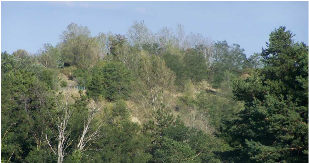
Figura 11 – ZOOM della immagine panoramica precedente (da ovest - zona della cava) - Scatto dal punto C