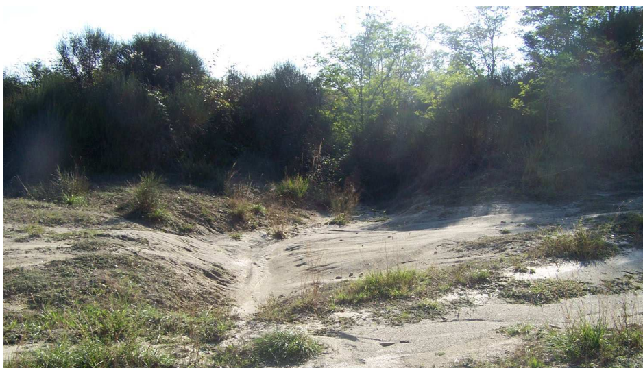
Figura 5 –Attuale scarico acque piovane all'ingresso dell'area di cava (Foto 2992)