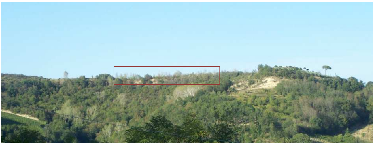
Figura 15 – Immagine panoramica della zona di cava vista da Sud - Scatto dal punto E