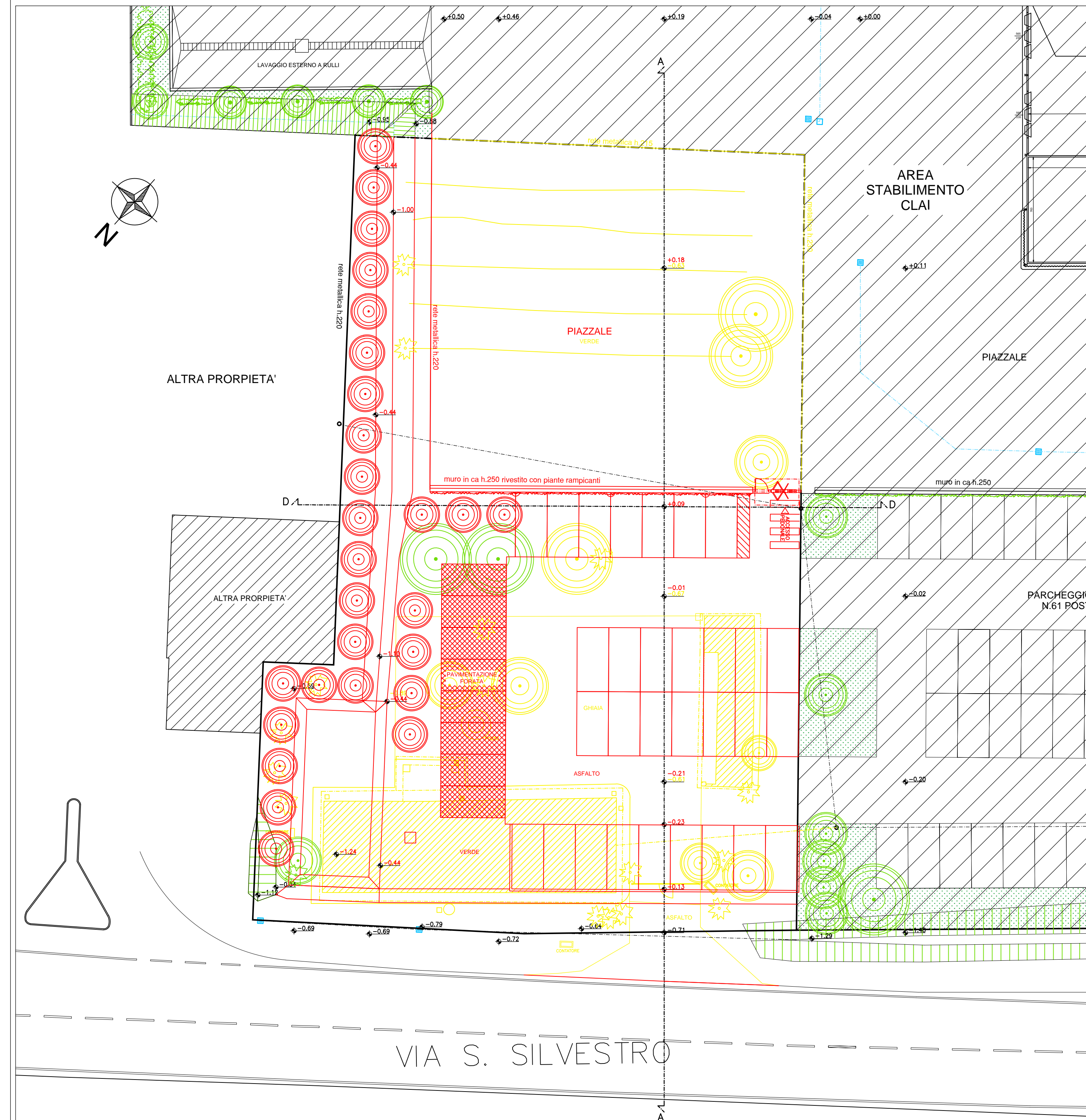
PLANIMETRIA GENERALE - SCALA 1:200