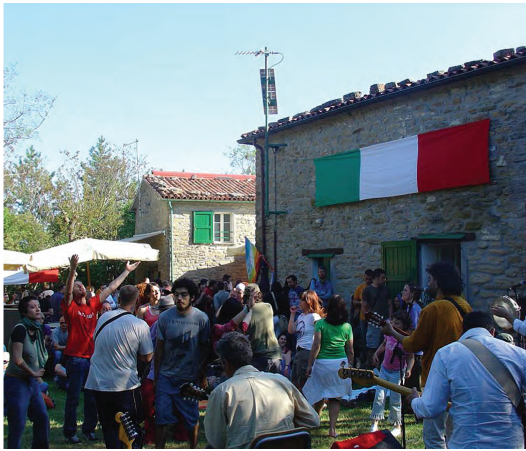
Foto scattata prima dell'emergenza sanitaria

Escursioni notturne, un pic-nic antifascista e la tradizionale camminata lungo il Sentiero dei partigiani